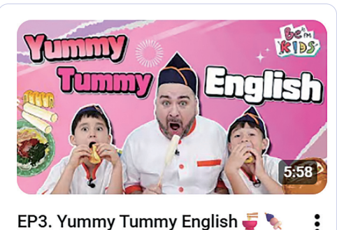
EP3. Yummy Tummy English 부산의 맛! 조회수 25만회 · 2개월 전