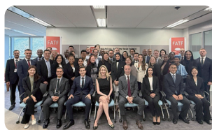
국제기구 인턴십 2 개 기관 2 명