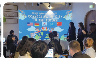
글로벌 청년 앰버서더 4 개국 16 명