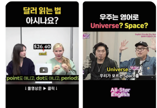
달려 읽는 법 아시나요? #shorts 조회수 208만회 | Space와 Universe의 차이? #shorts 조회수 201만회