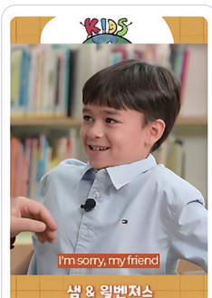
“몸으로 말해요” #english #Quiz #Friendship ... 조회수 6.6만회