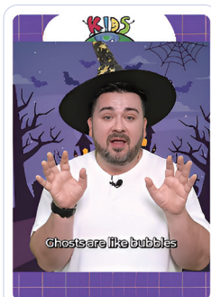
Peek-A-Boo Dad's Halloween Story 'Funn... 조회수 3.1만회