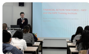
국제(금융)기구 아카데미 52 명

“이론에서 파견까지, 글로벌 기구로 나아가는 부산 청년들의 커리어 발판 ”