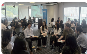
부산 글로벌 리더십 프로젝트 청년 해외연수 (총 12 명 파견/방국, 뉴욕)