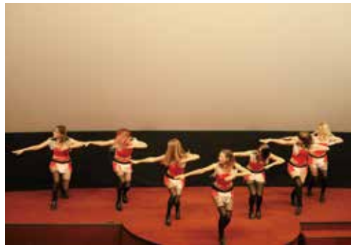
▲ 러시아 현지팀 K-pop 축하공연