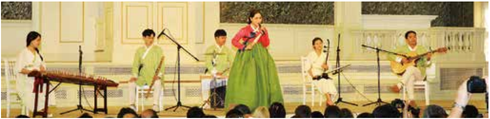
▲ 가ैया 퓨전국악 ▼ 단체 기념촬영