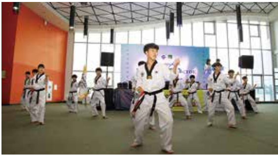
▲ 태권도 시범