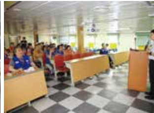
▲ 항만물류 강의