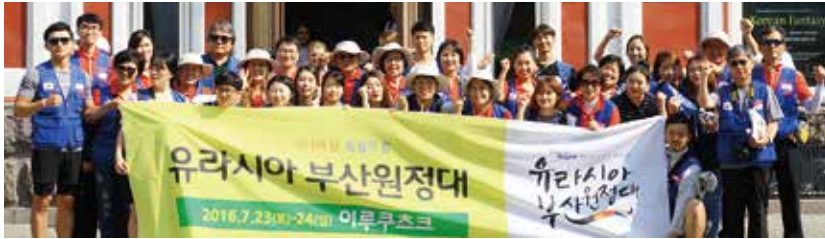
◀ 부산영화제 관객석 ▲ 기념촬영