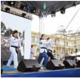
태권무(현지팀) 상트페테르부르크 시 대표 환영사