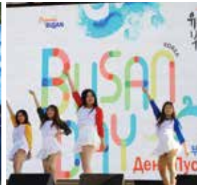
K-pop 댄스 : 창원대