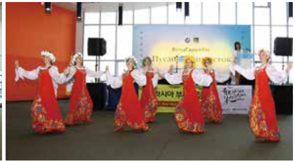
▲ 러시아 전통무용