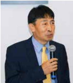
주 러시아 대한민국 대사관 정무공사 환영사