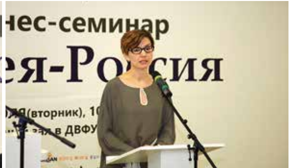
▲ 블라디보스토크 경제국장 인사말씀