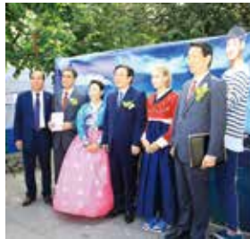
한복체험 및 포토존