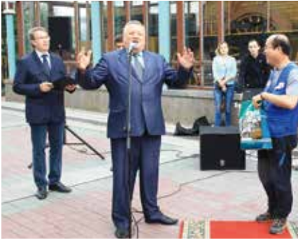
노보시비르스크 제1부시장 환송사