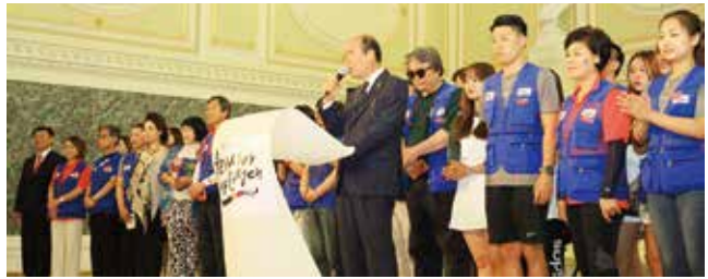
유라시아 부산원정대 무대인사