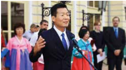
▲ 주 이르쿠츠크 대한민국 총영사관 영사 환영사