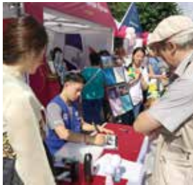
한글이름 써주기 현지 한글학교 공연