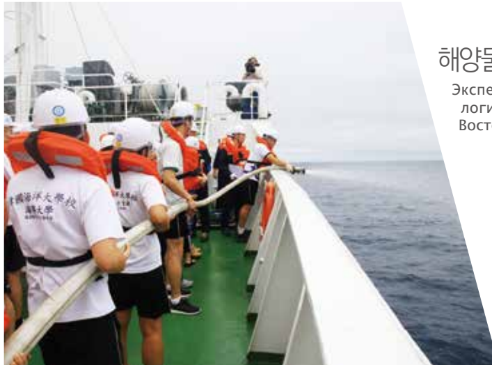
◀ 선내 견학

Экспедиция по морскому логистическому пути по Восточному морю Кореи