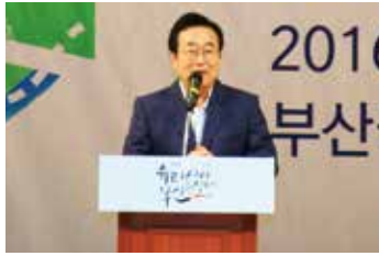
▲ 부산시장 인사말씀