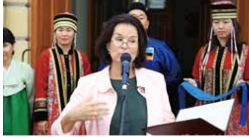
▲ 이르쿠츠크주 문화부 전문예술관리국장 환영사