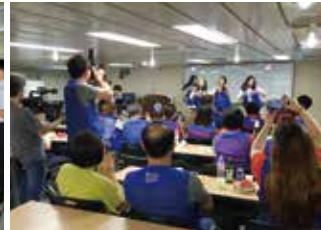
▲ 화합의 밤