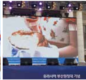
부산원정대 영상 감상 테이프 커팅식