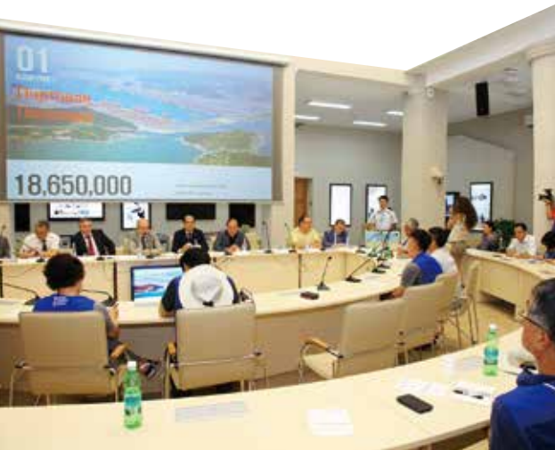
▲ 부산소개 PT