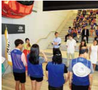
한국게임 팀 대항전