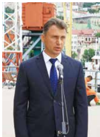
▲ 블라디보스토크 부시장 환영사