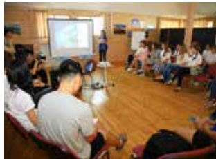
▲ 부산소개 PT