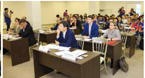
▲ 세미나 : 극동러시아 투자와 진출을 위한 법률적 지원방안