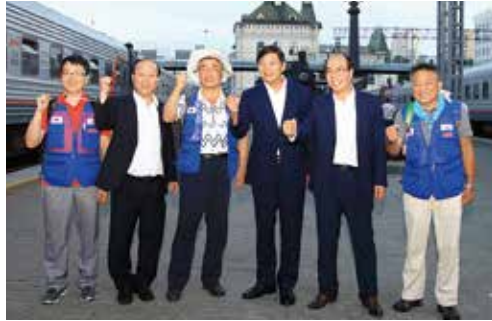
부산시 부시장 부산원정대 격려