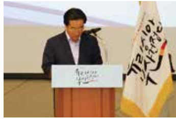
▲ 부산시 통상진흥국장 경과보고