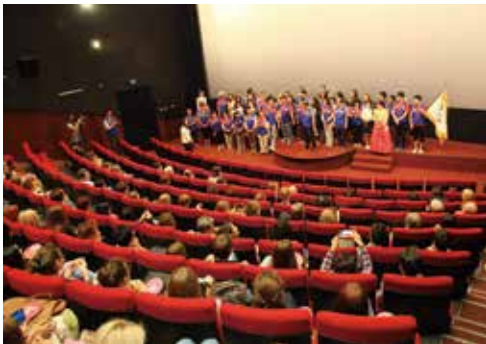
▲ 부산원정대 무대인사