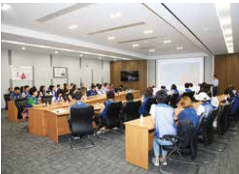
LG전자 러시아 생산법인 소개