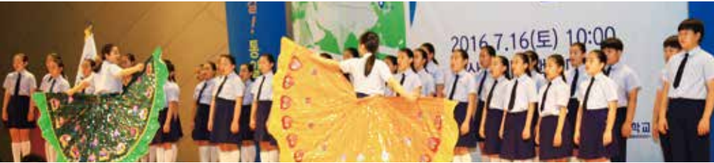
▲ 축하공연 : 부산시립소년소녀합창단