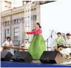
가야 퓨전국악 부산시장 인사말씀