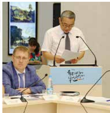
▲ 고려인 역사강의