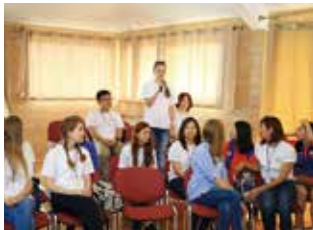
▲ 참가자 자기 소개