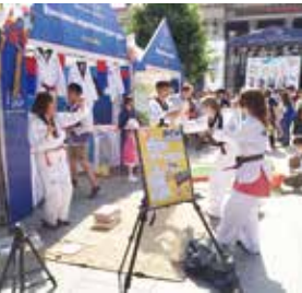
한국문화체험 : 태권도 K-pop 경연대회