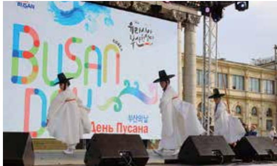
한국전통무용 : 창원대