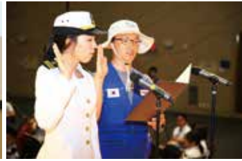
▲ 부산원정대 대표 발대선언