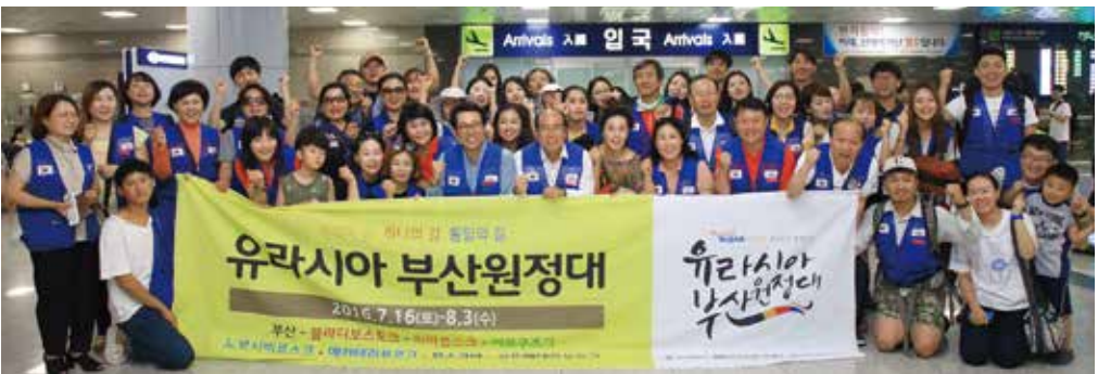
▲ 유라시아 부산원정대 해단식