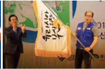
▲ 부산원정대기 전달