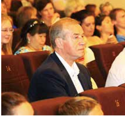
▼ 이르쿠츠크주지사 참석