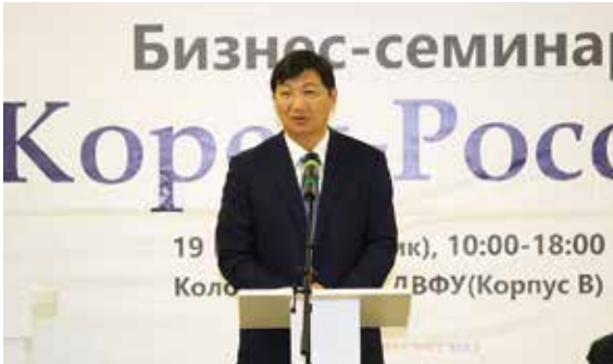
▲ 부산시 경제부시장 인사말씀