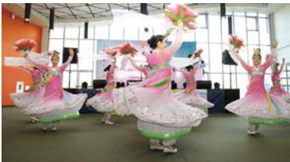
▲ 고려인 한국 전통무용